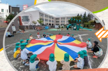
園庭で行う運動会